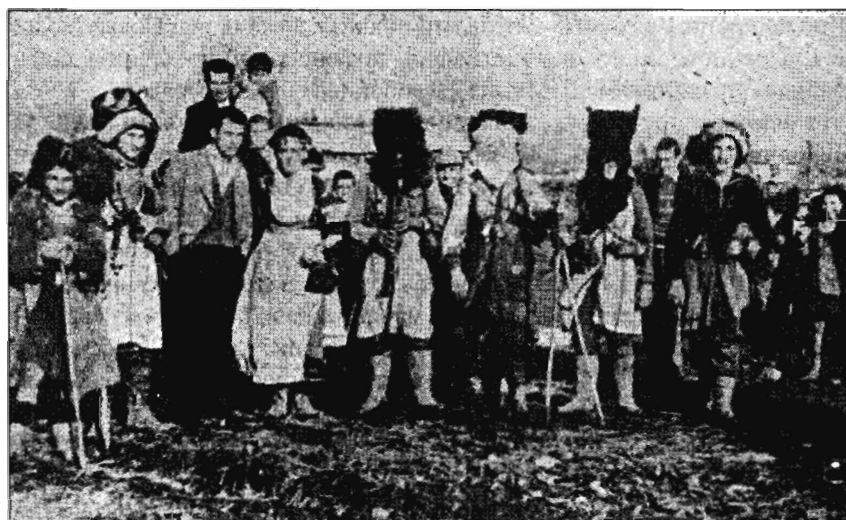
Рис. 2. Γρυππα Ρογκατσάρια υζ δ. Μεγάλος Παλαμάς (Καρδίτσα) 1958 ε.: «Αραπι» в масках υζ οσечных ικγυρ // Λαογραφία. Δελτίο της ελληνικής λαογραφικής εταιρείας. Αθήνα, 1957.