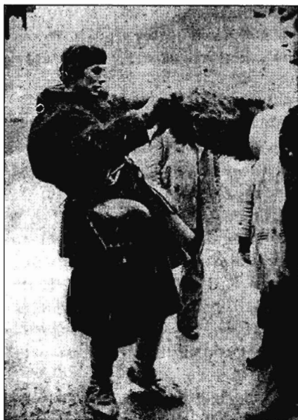
Рис. 4. «Арап», готовящийся надеть «барботу» // Лаογραφία.

Δελτίο της ελληνικής λαογραφικής εταιρείας, Αθήνα, (1979–1981).