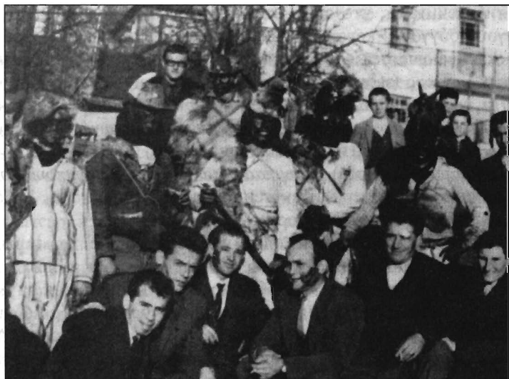
Рис. 7. «μπομπάρε» в Επταχώρι της Καστοριάς. Лица, вымазанные сажей, шкура медведя на плечах. Характерная особенность масок в этой области – набитые сеном чучела зайца или белки, которые крепились сверху к головному убору (Μακεδονική Ζωή, 1987. № 1. С. 17).