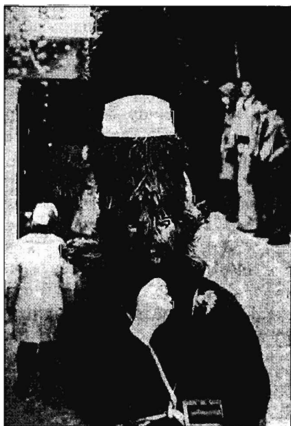
Рис. 5. «Арап» в «барботе» // Лаογραφία. Δελτίο της ελληνικής λαογραφικής εταιρείας.