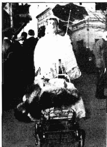
Рис. 6. Одна из масок на новогоднем карнавале в Касторье // Μακεδονική Ζωή , 1984. № 1. С. 32.

В представлениях о рогкатсариях смешалось не только «героическое», «комическое», но и «демоническое». Обходы домов ряжеными совершались с Нового года и до следующего за Крещением дня, когда, согласно народной традиции, души умерших предков и зловредные демоны ( каликандзары ), проведя среди людей двенадцать дней, снова уходили под землю. Зачастую и сами рогкатсарии воспринимаются как злые духи: в некоторых селах Фессалии их прямо называют каликандзарами (καλκάντζαροι); некоторые рассказы о бесчинствах рогкатсариев демонстрируют поразительное сходство с быличками о каликандзарах: «Помню я, мне отец говорил, поехал он раз молотъ на мельницу, и когда возвращался, один (рогкатса-