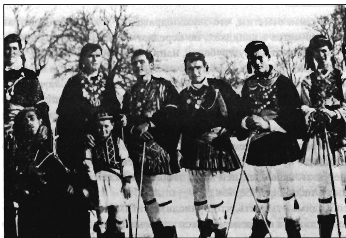
Рис. 8. Рогкатсары из Гревены, 1 января 1960 // Μακεδονική ζωή, 1984. № 1. Σ 35.