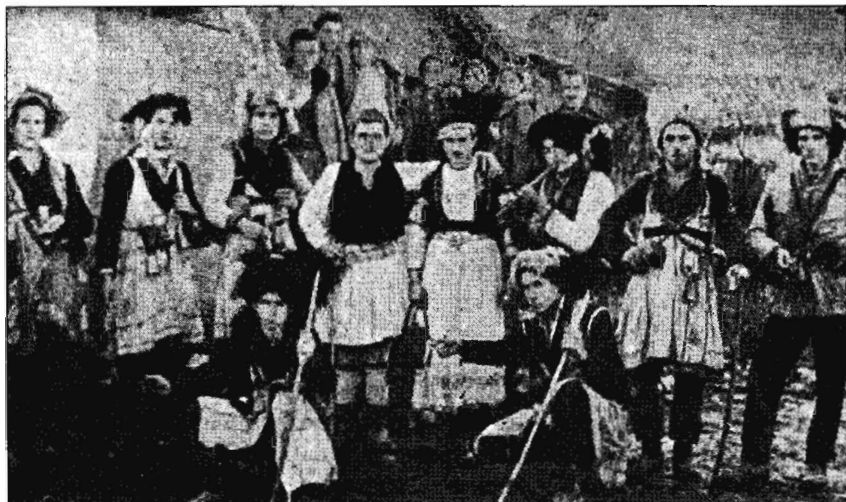
Рис. 1. Γρυππα Ρογκατσάρια υζ δ. Μεγάλος Παλαμάς (Καρδίτσα) 1958 ε.: в центре «женух» с «пневстоῦ» // Λαογραφία. Δελτίο της ελληνικής λαογραφικής εταιρείας. Αθήνα, 1957. Τ. ΙΖ'.